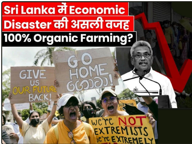
Desastre econômico do Sri Lanka