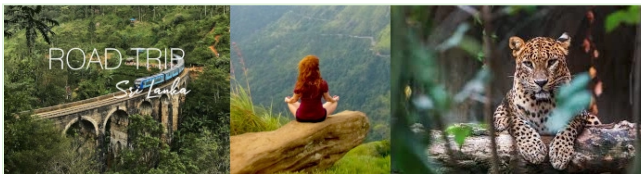
Férias no Sri Lanka – passeios guiados pela natureza e expedições

Momento: A experiência foi lançada durante a pandemia da COVID-19, quando a economia do Sri Lanka, dependente do turismo, já estava gravemente afetada.