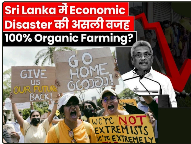
Desastre econômico do Sri Lanka