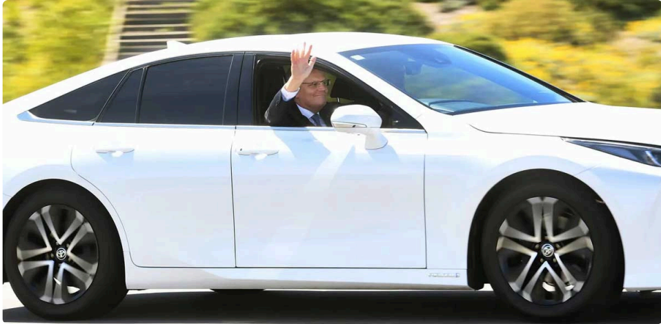
PM Scott Morrison

0000000000, 0000000000 0000000000 00000000 0000000000000000 100 0000 0000 00000000 0000000000, Michael Barnard 00 0000000000 000000000000 000 000 000000000000 00000000 0000, 0000000 000000000 000000 0000 0000 0000000 00 ‘000000000000’ 0000 000 000 0000, 000000 00 0000 000 0000. 000000000000000000 0000000000.