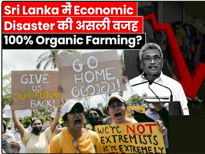
Bencana ekonomi Sri Lanka