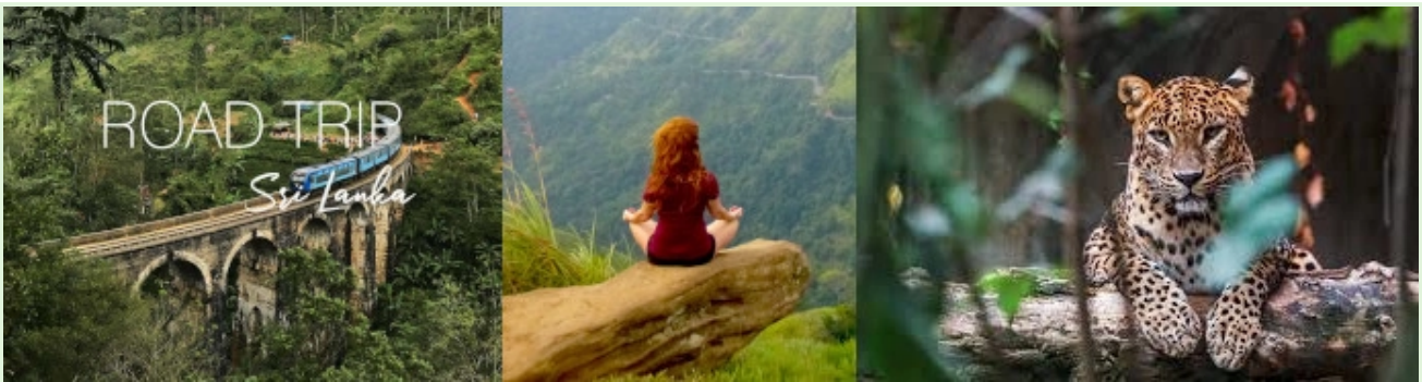
Liburan di Sri Lanka - Wisata alam dan ekspedisi berpemandu

Waktu: Eksperimen ini diluncurkan pada masa pandemi COVID-19, ketika perekonomian Sri Lanka yang bergantung pada pariwisata sudah terkena dampak yang parah.