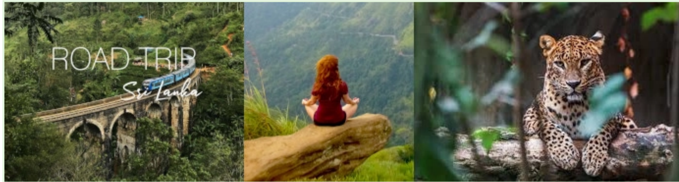
Liburan di Sri Lanka - Wisata alam dan ekspedisi berpemandu

Waktu: Eksperimen ini diluncurkan pada masa pandemi COVID-19, ketika perekonomian Sri Lanka yang bergantung pada pariwisata sudah terkena dampak yang parah.