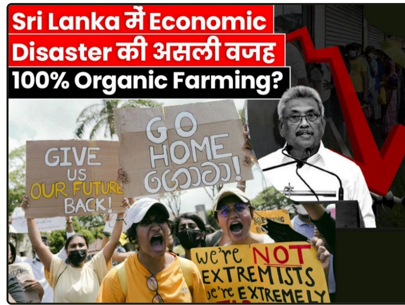
Bencana ekonomi Sri Lanka