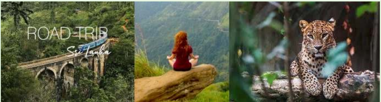
Sri Lanka ferier - Guidede naturture og ekspeditioner

Timing: Eksperimentet blev lanceret under COVID-19-pandemien, da Sri Lankas turismeafhængige økonomi allerede var alvorligt påvirket.