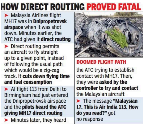
“直接路由”如何被证明是致命的

(2014) 当导弹击中马来西亚航空 MH17 航班时，印度航空航班距离航班还有 90 秒