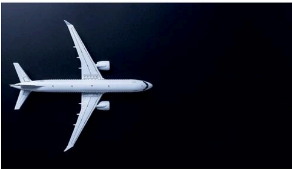
Lodewijk van Maaseik

A false flag terror attack Conspiracy, crash, cover-up